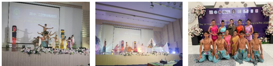
ภาพที่ 7 การเผยแพร่ผลงานการแสดงสู่สาธารณชนในโครงการนำเสนอผลงานสร้างสรรค์ทางศิลปกรรมศาสตร์ระดับนานาชาติ ครั้งที่ 1 ณ มหาวิทยาลัยราชภัฏพระนครศรีอยุธยา