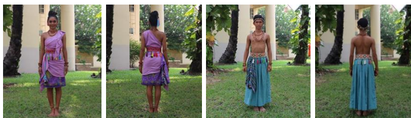
ภาพที่ 4 การแต่งกายด้านหน้าและหลังของผู้หญิงและผู้ชาย

เครื่องแต่งกายเรียบง่ายจะต้องพิจารณาวัสดุตัดเย็บที่มีความเหมาะสมเนื้อผ้าที่ถ่ายเทอากาศและมีน้ำหนักที่เบาเหมาะกับการเคลื่อนไหวร่างกายประกอบการแสดง