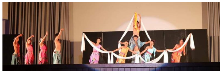
ภาพที่ 3 สร้างสรรค์การออกแบบลีลาทางนาฏศิลป์ องค์กรที่ 3

องค์กรที่ 3 กำบางขวย (การลอยเรือ) นักแสดงใช้ผ้าที่ขาวที่พริ้วบางเบานำมาเชื่อมต่อกันให้เป็นเรือเพื่อลอยส่งดวงวิญญาณของบรรพบุรุษ