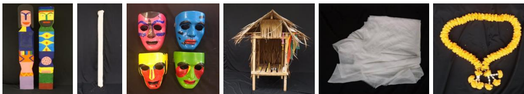
ภาพที่ 5 อุปกรณ์ประกอบการแสดง

ขั้นตอนที่ 6 การออกแบบอุปกรณ์การแสดง ผู้วิจัยได้นำอุปกรณ์มาประกอบการแสดง โดยใช้โคมในการสร้างโดยเพื่อเป็นสัญลักษณ์ในการสื่อความหมาย อุปกรณ์ประกอบการแสดงในครั้งนี้ประกอบด้วย เส้า, ไม้, หน้ากาก, ศาล, ผ้า และพวงมาลัย