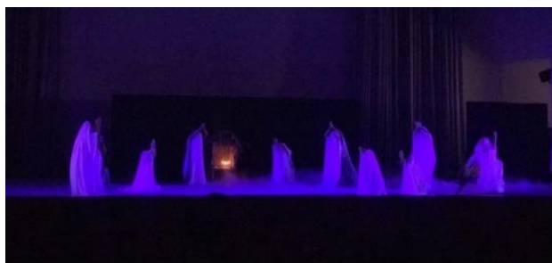
ภาพที่ 1 สร้างสรรค์การออกแบบลีลาทางนาฏศิลป์ องค์ที่ 1

องค์ที่ 1 ปูตี (การเข้าทรง) นักแสดงใช้ผ้าคลุมศีรษะสีขาวที่พริ้วบางเบาคลุมศีรษะที่สื่อถึงการเข้าทรงเพื่อสื่อสารกับวิญญาณ