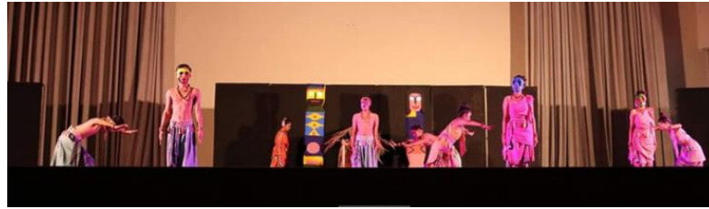
ภาพที่ 2 สร้างสรรค์การออกแบบลีลาทางนาฏศิลป์ องค์กรที่ 2

องค์กรที่ 3 กำบางขวย (การลอยเรือ) นักแสดงใช้ผ้าที่ขาวที่พริ้วบางเบานำมาเชื่อมต่อกันให้เป็นเรือเพื่อลอยส่งดวงวิญญาณของบรรพบุรุษ